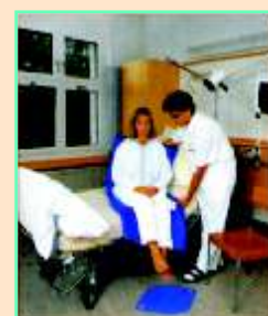
TURNPLATE otočný kotouč