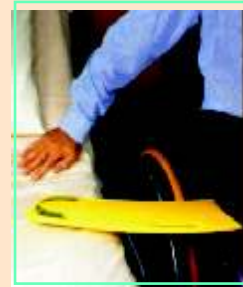
GLIDEBOARD kluzná deska