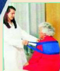
PAT - SLING pro přesun