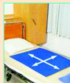
CARECLIDE podložka k přesunu