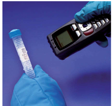
Obr. 4 – Ruční skener etiket

Skenery Čtečky čárových kódů 1D lineárních a 2D datamatrix kódu, propojení s PC pomocí USB kabelu, případně s pamětí, displejem a bluetooth pro vzdálené připojení.