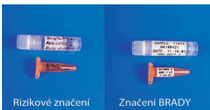
Obr. – Rozdíl ve značení

Komplexní řešení laboratorního značení BRADY zajišťuje odolnost vůči otěru, vložení více informací, rychlé a jednoduché vytvoření etikety, značení sérií, odolnost vůči chemikáliím a rozpouštědlům, ukládání dat, propojení s místní databází pro využití dat, možnost tisku čárových kódů včetně speciálních 2D čárových kódů.