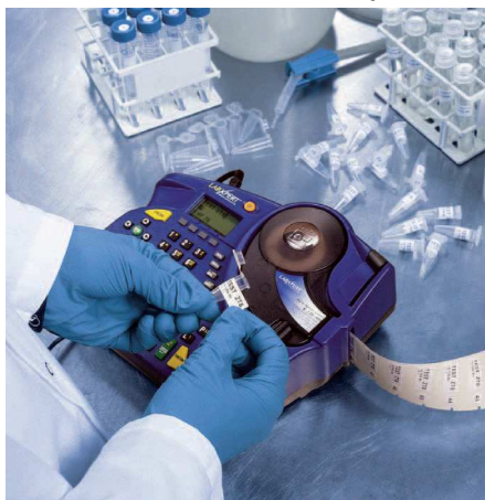
Obr. 2 – Přenosná tiskárna Labxpert

Stolní s připojením k PC – BBP11, BP-THT IP Printer, BP- PR Plus; propojení s databází laboratoře.