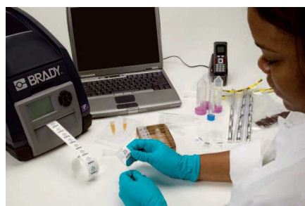
Obr. 3 – Stolní tiskárna BP-THT IP 300